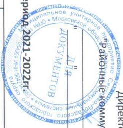
График остановки котельных МУП "РКС" для проведения ПТР и подготовки к работе в осенне-зимний период 2021-2022гг.